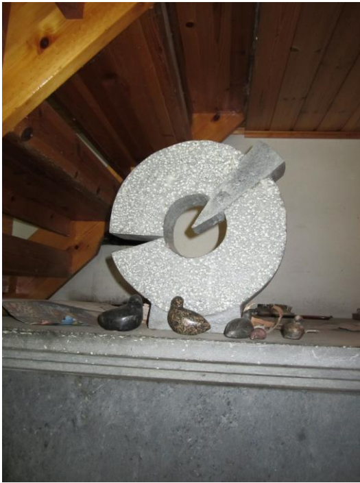
Kivityö nimeltä Läpi harmaan kiven.