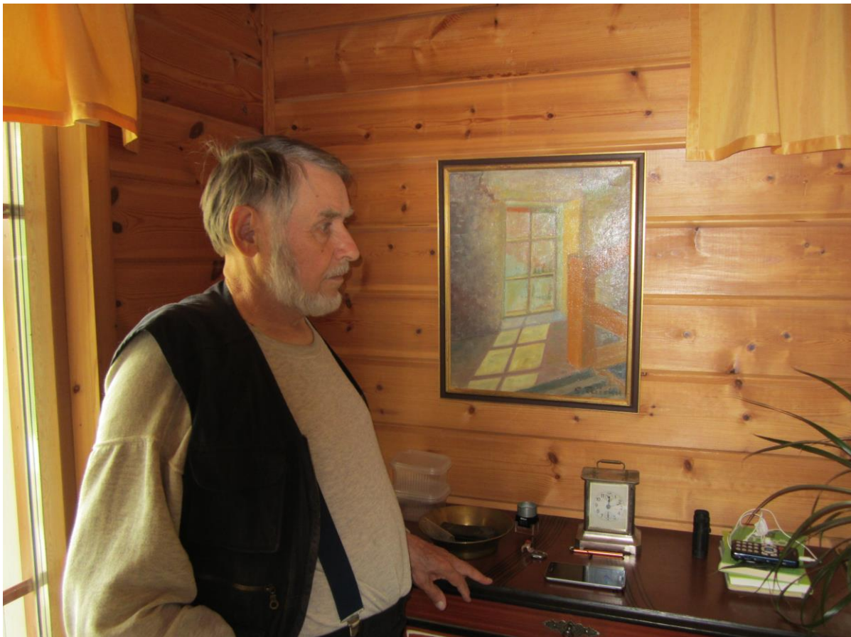
Tuiskun maalaustaidetta. Malli Vanajanlinnan ulkorakennuksesta