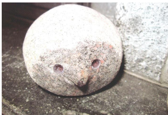
Seppo Tuiskun kivityö